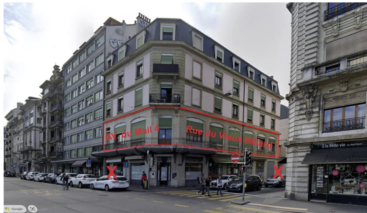
Locaux du Club Alpin Suisse section de Genève

Avenue du Mail 4 1205 Genève Entrée derrière portail Rue du Vieux Billard